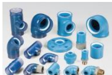
プレシールコア継手