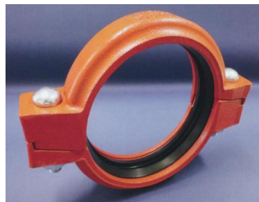
トップジョイントR-0 II