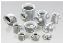
プレシール白継手