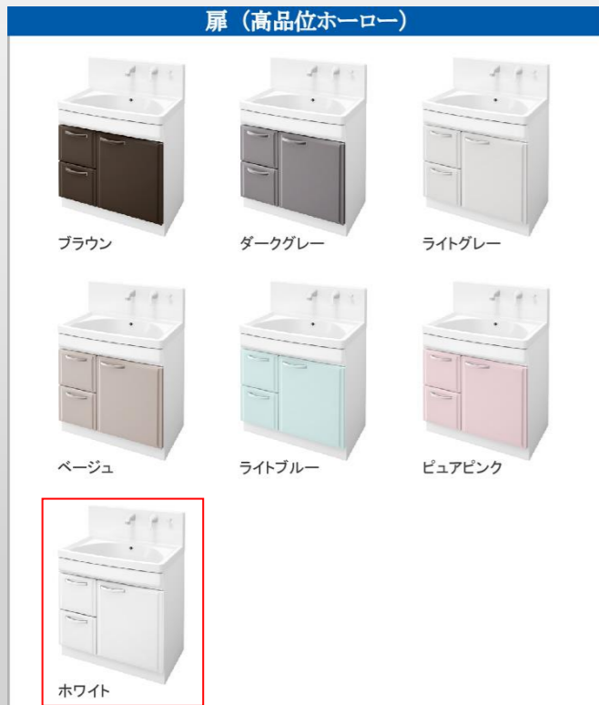
※写真はハイバックタイプです。